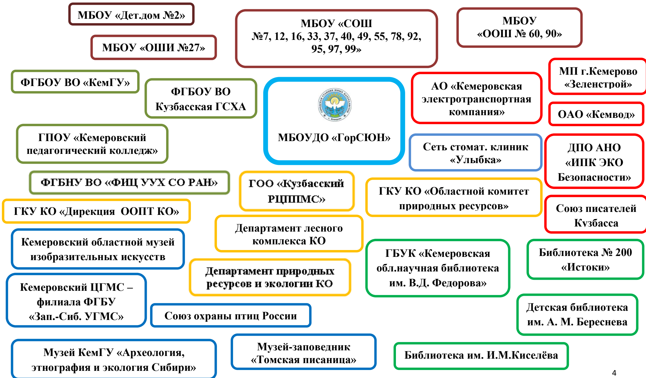
СХЕМА взаимодействия МБОУДО «ГорСЮН» с учреждениями и организациями